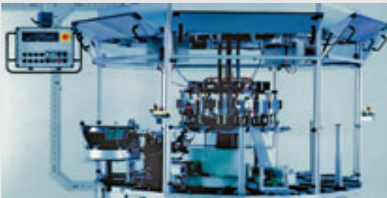
Electronique industrielle et machine